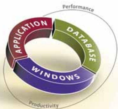
改善应用、数据库及 Windows 架构的性能和运行效率

公司总部: 美国加州, Aliso Viejo 员工数量: 全球约 2,500 名 创建时间: 1987 IPO: 1999 Nasdaq 代码: QSFT 2005 营业额: $476 million 年增长率22% 用户数: 全球 50,000 家